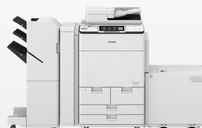
iR ADV DX C7700