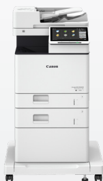
iR ADV DX 717/617/527