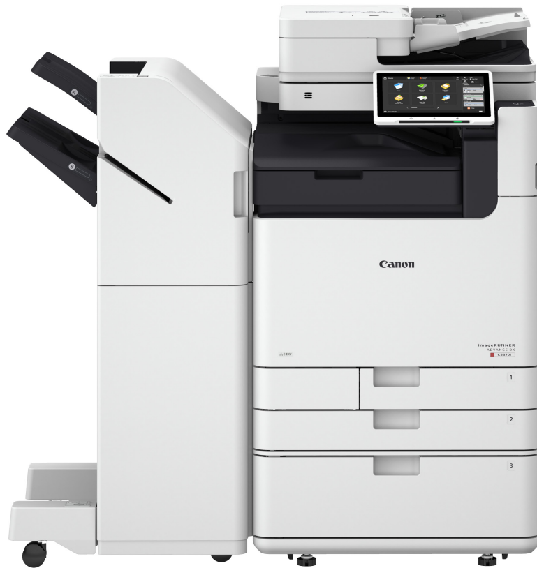
iR ADV DX C5800

Uusimmat imageRUNNER ADVANCE C5800 -sarjan laitteet tuottavat jopa 18 % vähemmän hiilidioksidipäästöjä ja painavat 20 % vähemmän kuin edeltäjänsä.